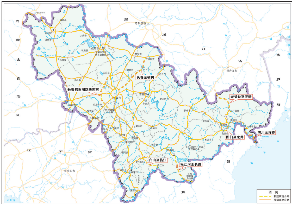
图 5 吉林省“十五五”高速公路规划项目示意图

加快完善航空网。优化“一主多辅”机场布局，提升长春龙嘉国际机场服务能级。推进延吉机场迁建投运。推动一批支线机场改扩建和通用机场建设项目前期工作。加密国际、省际航班航线，提升辐射集聚能力。