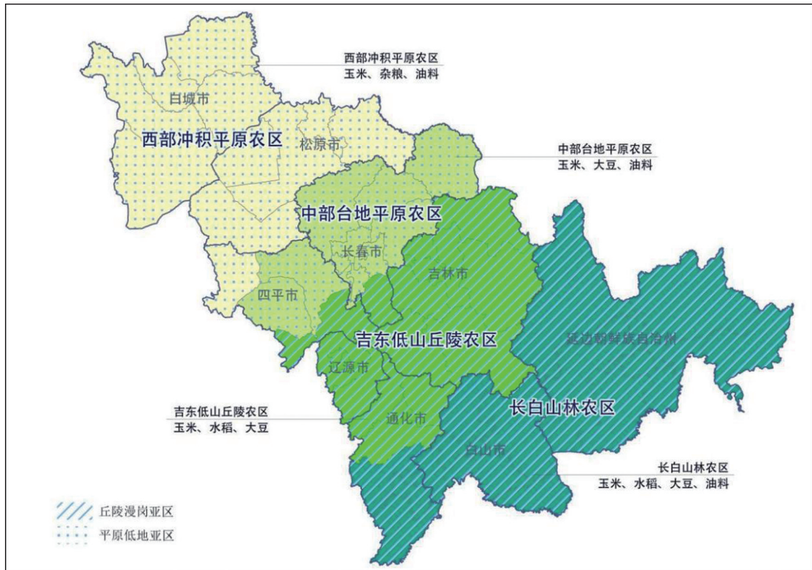
图 1 吉林省高标准农田建设分区图

加快推进现代种业振兴。实施种质资源保护与利用行动，健全农作物、畜禽、水产、林草、微生物种质资源保护利用体系，建设东北主要农作物基因资源综合鉴定平台。实施种业自主创新行动，坚持“以种适地”，研发培育高产耐密植玉米、高产耐盐碱水稻、高油高蛋白大豆、高产优质高粱等具有领先地位的突破性品种，打造寒地区域育种中心。实施基地保障水平提升行动，高标准建设公主岭水稻、洮南玉米国家制种基地，筛选推广玉米、水稻、大豆重大品种和高粱、藜麦、茭白等优异特色品种。实施种业发展环境优化行动，修订《吉林省农作物种子条例》，强化农作物品种全链条管理，建设国家农作物种子质量检测分中