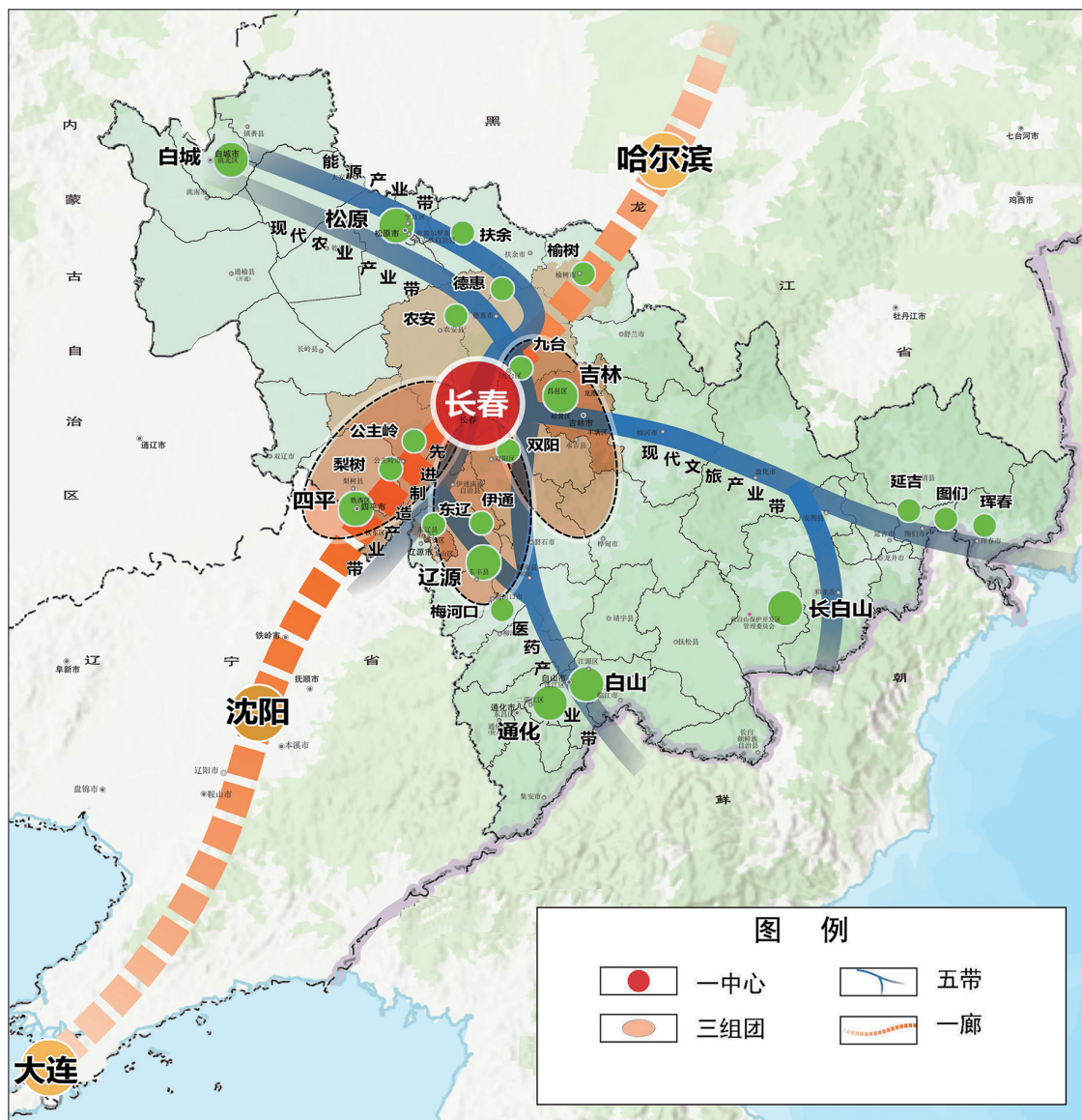
图 2 长春现代化都市圈空间布局图

东北城市群一体化，推动哈长沈大联动发展，深化与沈阳都市圈产业创新融合，实现优势互补和产业链分工协作。加强与辽宁沿海经济带联动发展，积极参与重点城市群联动发展，推动设施互联互通、市场循环互动，打造集现代物流、产业协作、联合创新、环线文旅为纽带的合作走廊。